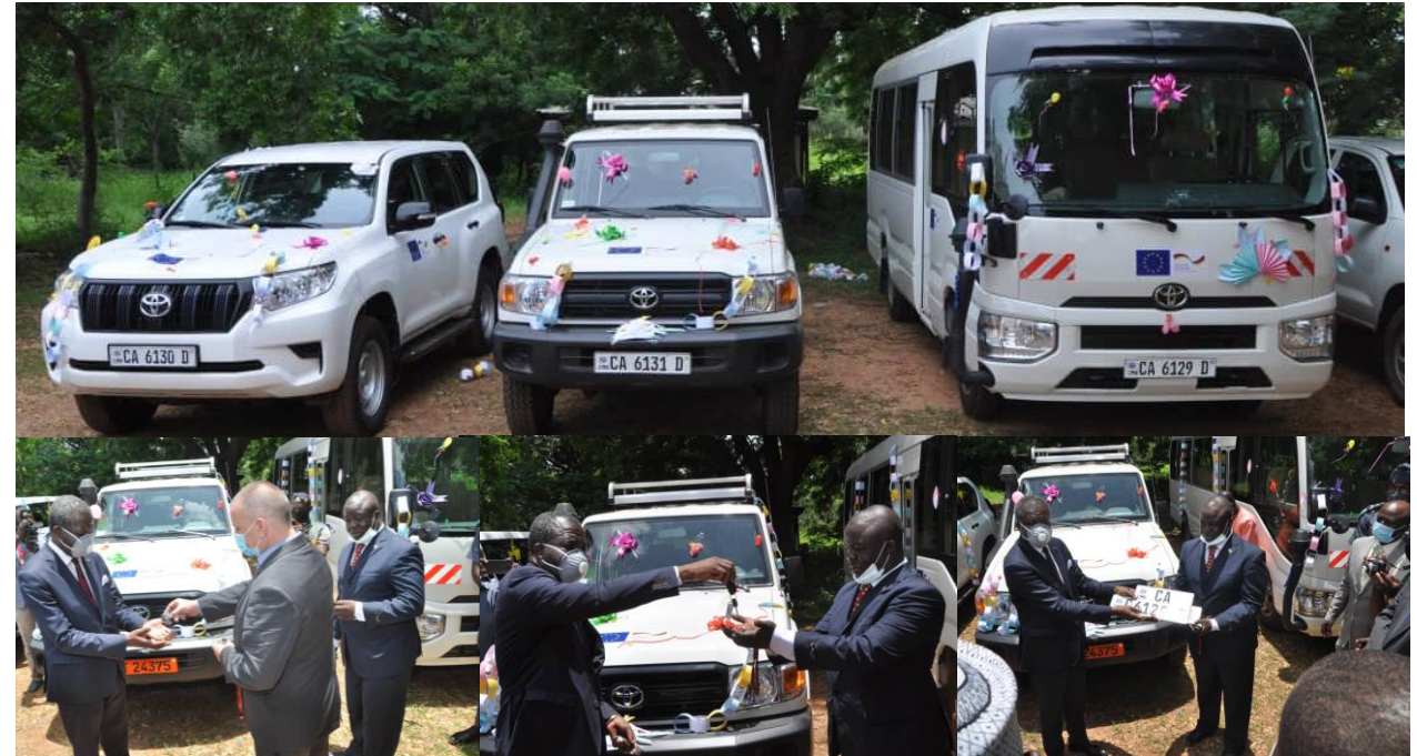
Remise solennelle des véhicules à l'EFG (28/08/2020)