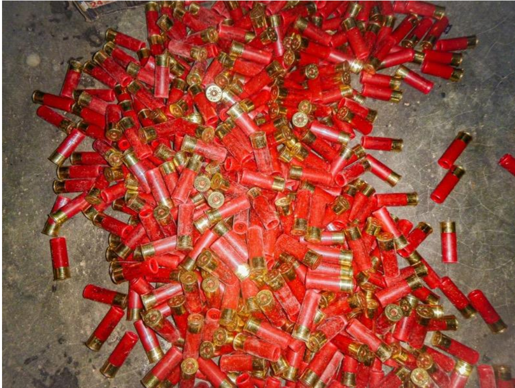
Presque deux mille cartouches

Grâce aux informations reçues, les écogardes ont arrêté un individu arrivé du Congo avec plus de mille munitions à vendre au sein des APDS.