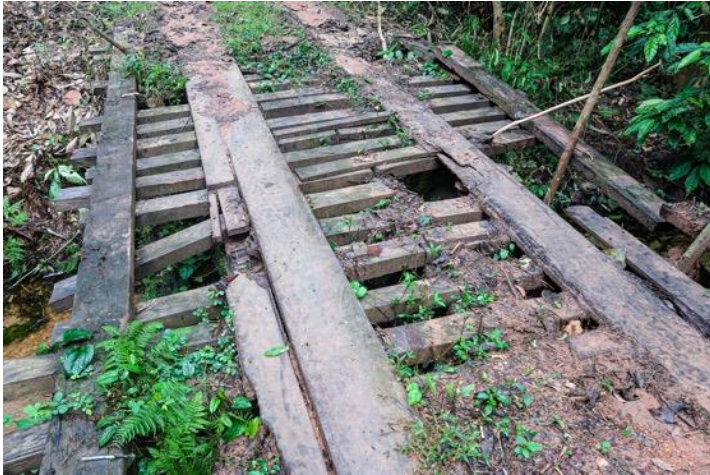
Le vieux pont

Le pont en bois sur la piste menant à Dzanga bai, qui se dégrade déjà depuis un certain temps, est devenu impraticable et nous avons décidé d'en construire un nouveau avec des rails en ciment et en fer pour assurer sa durabilité et son utilisation à long terme.