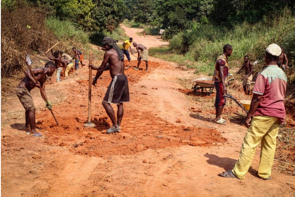
En train de réparer la route

Après la saison des pluies qui vient de s'achever, la route principale de Bangui était en très mauvais état, rendant l'accès à Bayanga très difficile. Après plusieurs réunions avec les représentants des différents villages situés le long de cette route, nous sommes parvenus à un accord pour mettre en commun les ressources afin de réparer les routes. Il a été convenu que les villages fournissent la main d'œuvre tandis que nous fournissons le matériel/équipement pour les travaux routiers ainsi que les repas communautaires pour les équipes.