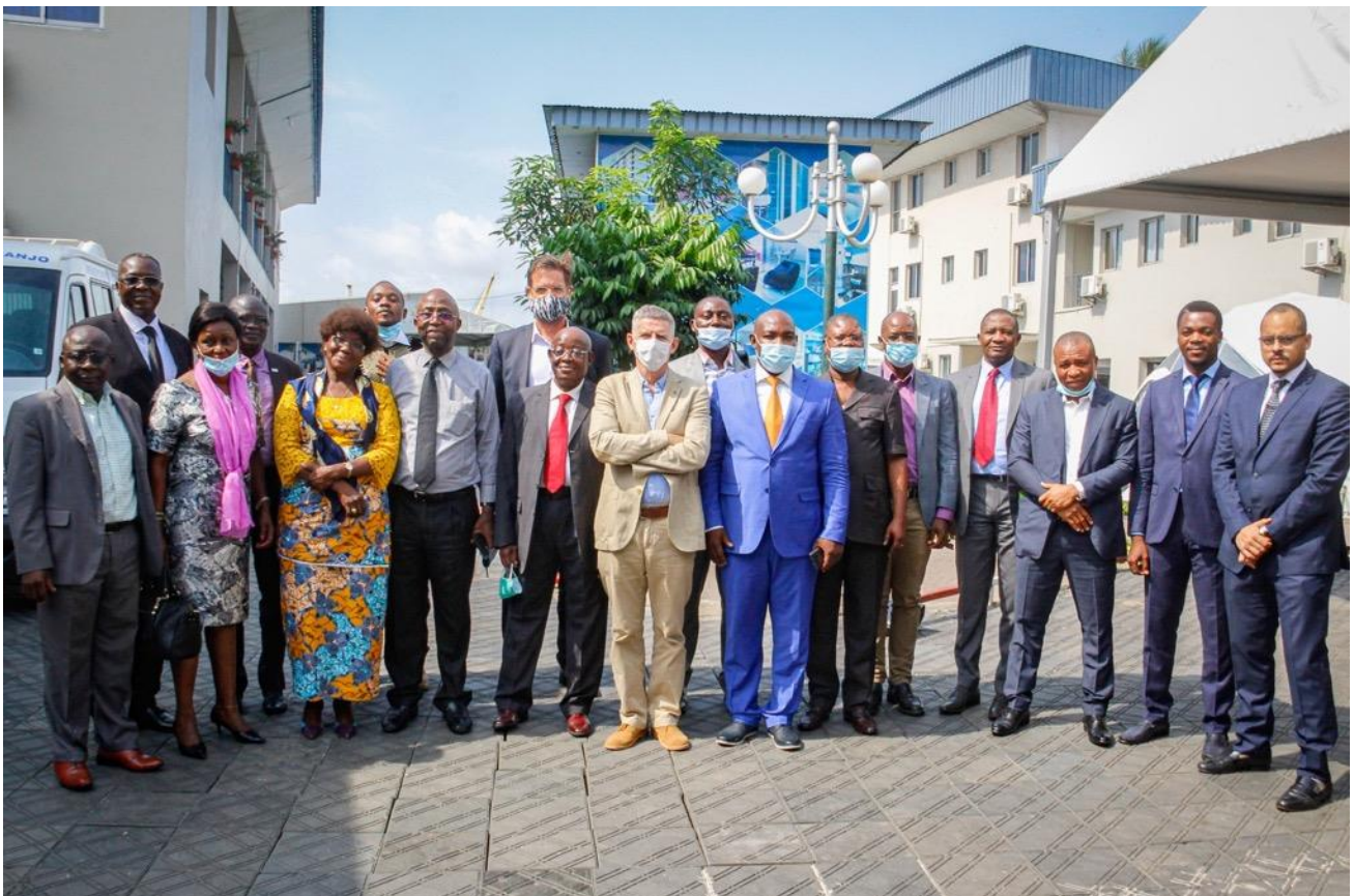
Participants à la réunion du Conseil d'Administration de la FTNS

Le Directeur et le Directeur Adjoint du parc ont tous deux assisté à la 26 ème réunion du Conseil d'Administration de la FTNS à Douala (Cameroun), au cours de laquelle le budget présenté a été approuvé. En réponse à l'arrêt du tourisme (résultant des restrictions COVID 19 et donc de la fermeture du parc) qui joue généralement un rôle important dans la gestion du parc et les engagements communautaires, la FTNS a légèrement augmenté sa contribution pour nous aider à pallier partiellement à cette difficulté de l'heure.