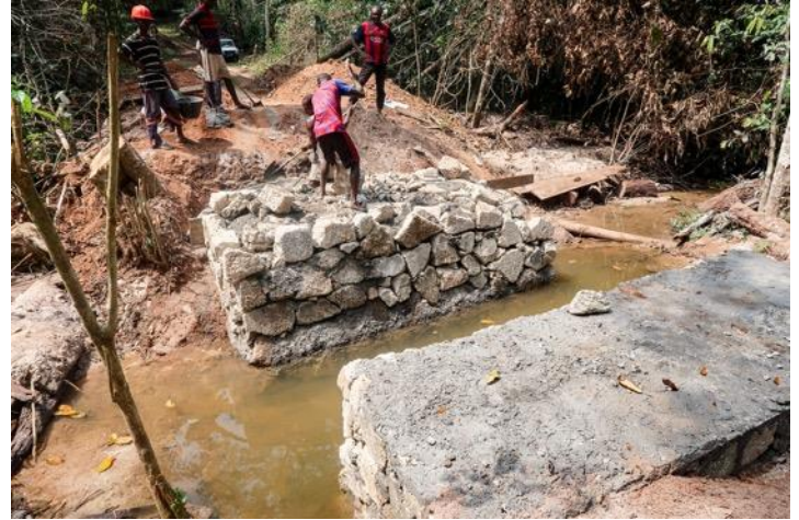
Et le futur nouveau pont

Le Directeur et le Directeur Adjoint du parc ont tous deux assisté à la 26 ème réunion du Conseil d'Administration de la FTNS à Douala (Cameroun), au cours de laquelle le budget présenté a été approuvé. En réponse à l'arrêt du tourisme (résultant des restrictions COVID 19 et donc de la fermeture du parc) qui joue généralement un rôle important dans la gestion du parc et les engagements communautaires, la FTNS a légèrement augmenté sa contribution pour nous aider à pallier partiellement à cette difficulté de l'heure.