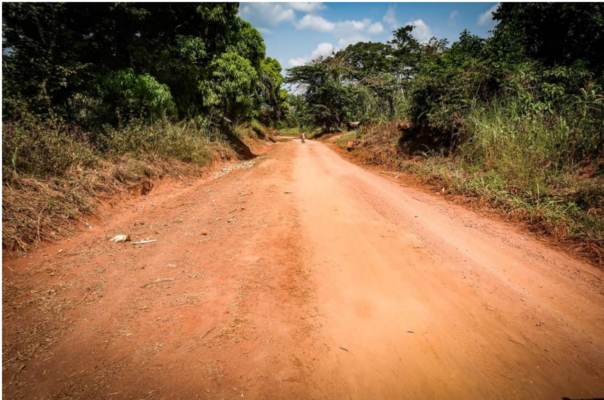
La nouvelle « AutoRoute » de la Sangha- Mbaere